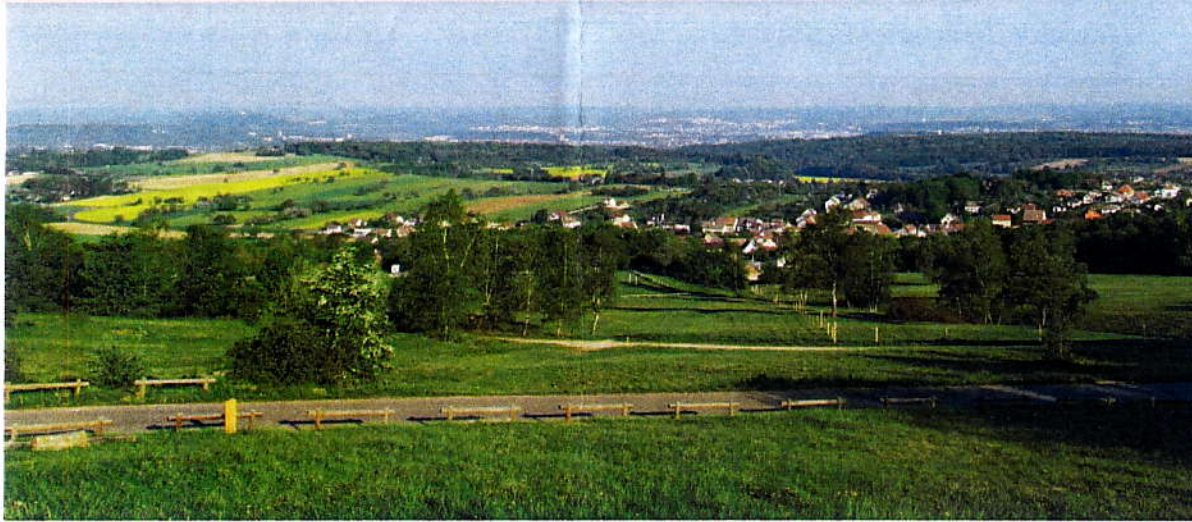
Table d'orientation de Vandoncourt